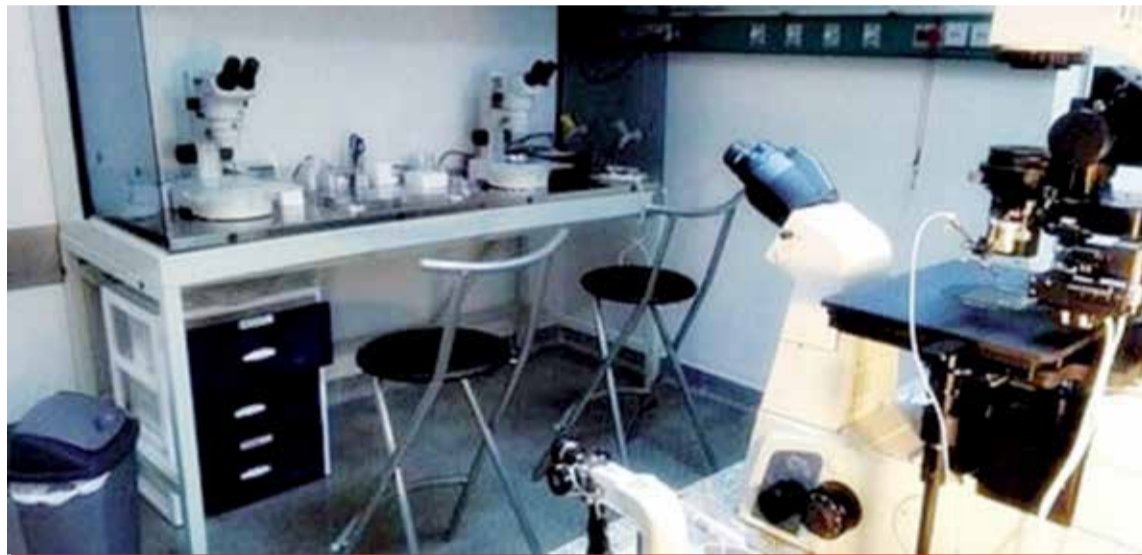
Este es el único hospital bonaerense que da cumplimiento a la Ley de forma integral.

La Ley provincial 14.208 permitió el acceso gratuito a los tratamientos de fertilización en Hospitales públicos; esto se vio facilitado posteriormente por la sanción de la Ley Nacional de Fertilidad 26.862.