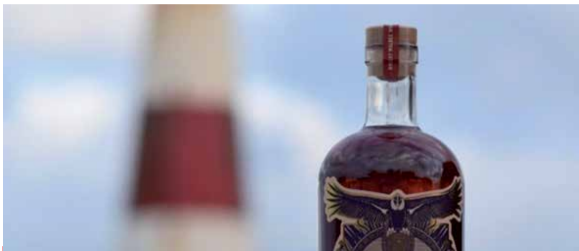
El producto ya se comercializa en Argentina, pero también se encuentra presente en algunos bares de Londres y Bruselas.